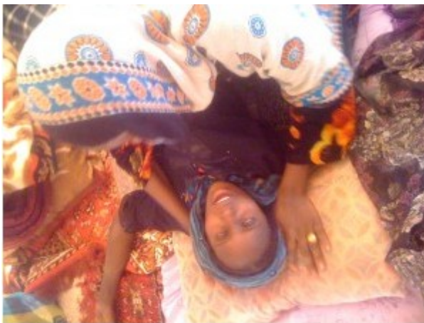
This recently vaccinated child is being attended to after becoming paralyzed.

関わっている組織 – WHO、GAVI、PATH、UNICEF、そしてビル&メリンダ・ゲイツ財団 – の声明はどこにあるのか？ なぜこのワクチン接種プログラムは停止されないのか？ これらの組織はグルロで起こした悪事で何をしようとしているのか？